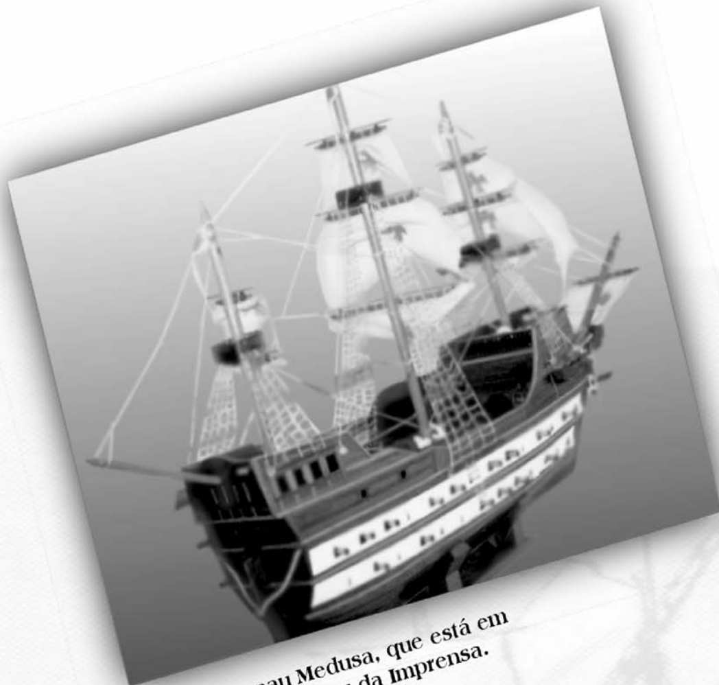
Réplica da nau Medusa, que está em exposição no Museu da Imprensa.

SIG, Quadra 6, Lote 800, Brasília - DF CEP 70610-460